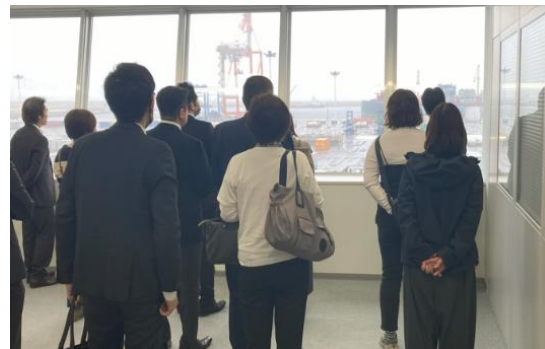
ターミナル全体の視察