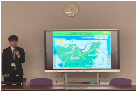
ターミナル概要説明

これからも北九州港の利便性をより多くの方に知っていただき、皆様にとって更に便利な港となるよう取り組んでまいります。