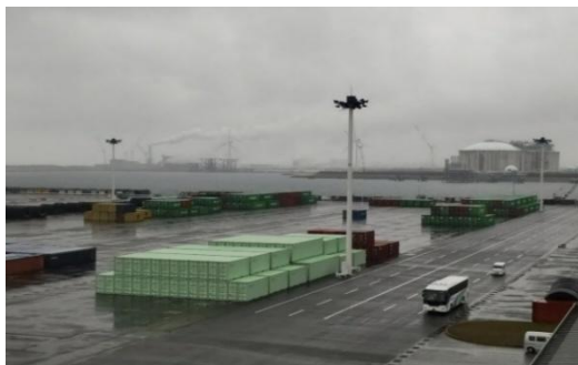
コンテナヤード内の視察